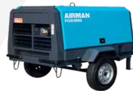
COMPRESOR NEUMÁTICO MOTOR DIESEL 49HP 185 CFM 100PSI