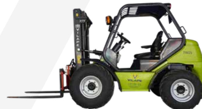
MONTACARGAS 1.7TN 4X4 2.5TN 4X4 3.5TN 4X4