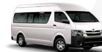
CAMIONETA DE PASAJEROS