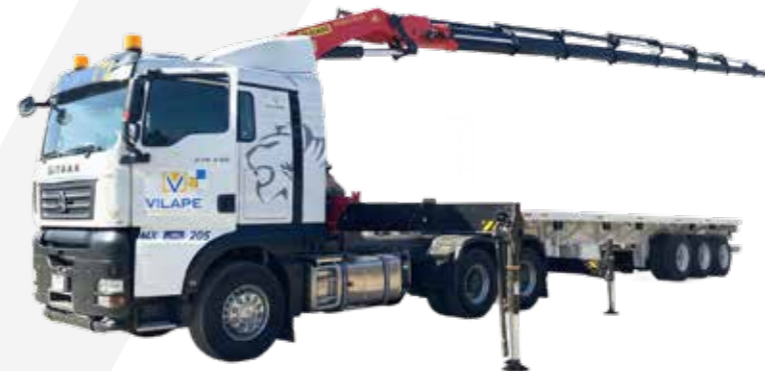
CAMIÓN GRÚA ARTICULADA PLANA DE 12 METROS -GRUA ARTICULADA PK42002 PLANA DE 6 METROS -GRUA ARTICULADA PK 27000