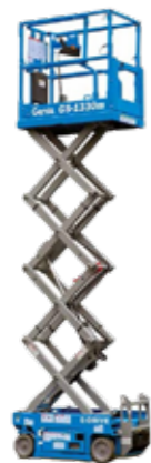
PLATAFORMA ELEVACIÓN TIJERA ALTURA MIN. DE TRABAJO 7.8M ALTURA MAX. DE TRABAJO 11.7M