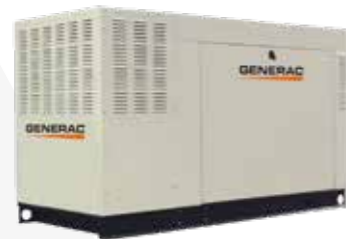
GENERADORES · 25KVA · 45KVA · 85KVA