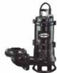
BOMBA SUMERGIBLE DE 3" Y 4" 220V TRIFÁSICA 5HP Y 10HP TRAGASÓLIDOS