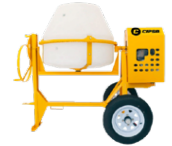
REVOLVEDORA MOTOR DE 9HP 1 SACO