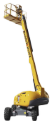
PLATAFORMA TELESCÓPICA ALTURA MIN. DE TRABAJO 20.5M ALTURA MAX. DE TRABAJO 42.2M