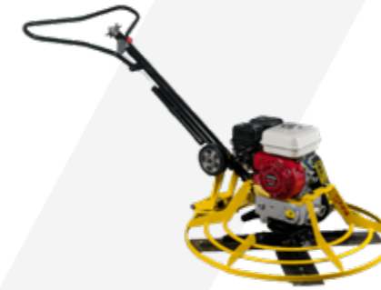
ALLANADORA SENCILLA DE 36" CON PLATO MOTOR GASOLINA 5.5HP