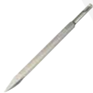
PUNTA LÁPIZ O CINCEL