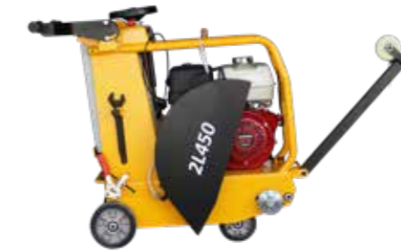
CORTADORA DE CONCRETO CON DISCO DE 14"