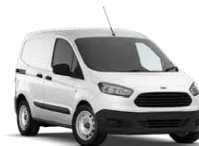
CAMIONETA DE TRABAJO