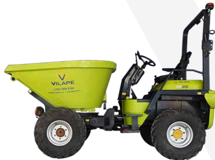
DUMPER 3.5TN 4X4 MOTOR DIESEL CON HY RAIL TOLVA GIRATORIA