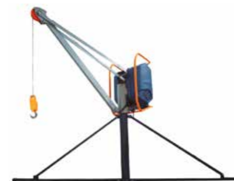
POLIPASTO ELÉCTRICO 300KG · CABLE 30M · 220V TRIFÁSICO