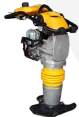
APISONADOR MOTOR GASOLINA 4HP PESO 75KG