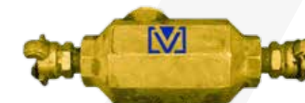
LUBRICADOR PARA MARTILLO