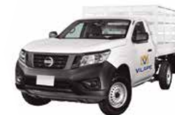
CAMIONETA DE CARGA ESTACAS