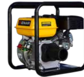
VIBRADORA DE CONCRETO · MOTOR GASOLINA 5.5HP · CHICOTE DE 6MTS · CABEZAL DE 25MM, 38MM, 1PULGADA