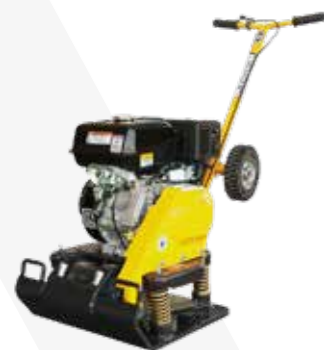
PLACA VIBRATORIA MOTOR GASOLINA 8HP PESO OPERATIVO 135KG