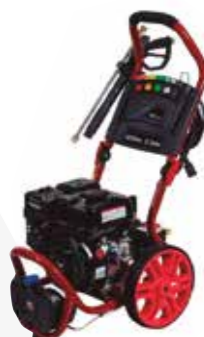
HIDROLAVADORA MOTOR GASOLINA 9HP 3200 PSI