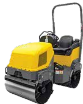
RODILLO DOBLE ARTICULADO MOTOR GASOLINA 20HP / 1200 KG MOTOR DIESEL 34HP / 2700 KG · PESO OPERATIVO 1200KG Y 2700KG