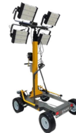
TORRE ILUMINACIÓN PORTÁTIL · 4 LÁMPARAS LED · COMPATIBLE CON GENERADOR 3,000W A GASOLINA · COMPATIBLE CON CONEXIÓN DE CORRIENTE ELÉCTRICA · EXTENSIÓN MÁSTIL 5M