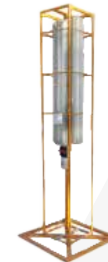
TORRE ILUMINACIÓN ELÉCTRICA PARA INTERIOR · CONEXIÓN ELÉCTRICA 110V · BASE Y ESTRUCTURA METÁLICA DE SEGURIDAD 80X80CM · EXTENSIÓN 2,40M · 4 LAMPARA LED