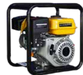
MOTOBOMBA 5.5HP MOTOR GASOLINA