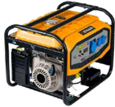
GENERADOR PORTATIL 3000W, 7000W Y 10000W MOTOR GASOLINA