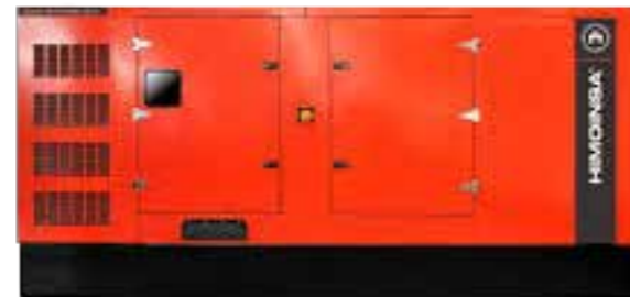
GENERADORES · 100KVA · 150KVA · 200KVA