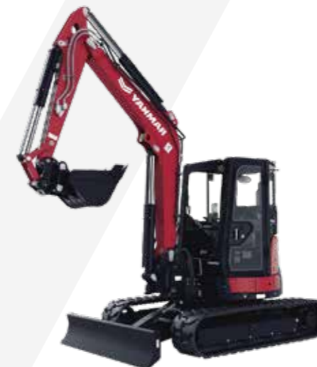
MINIEXCAVADORAS ORUGAS METÁLICAS Y NEUMÁTICAS 1.7 TON 3.5 TON 5.5 TON 10 TON