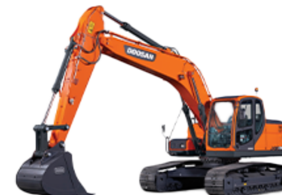
EXCAVADORAS 20 TONS ORUGAS METÁLICAS Y NEUMÁTICAS