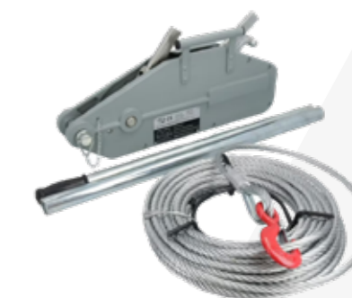
MALACATE 3 TONELADAS