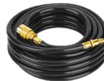
MANGUERA EXTRA PARA COMPRESOR 15M