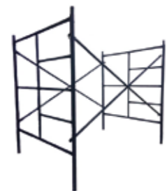
ANDAMIOS · ESTÁNDAR 1.5 X 2M · BANQUETERO 1 X 2M · MEDIO ANDAMIO 1M ALTO X 1,50 ANCHO