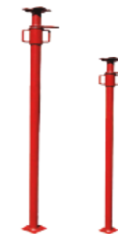
PUNTALES · 1.80 A 3M · 2.7 A 5M