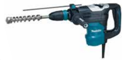
ROTOMARTILLO ELÉCTRICO 6KG