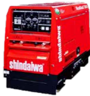
SOLDADORA 185AMP Y 340AMP MOTOR GASOLINA