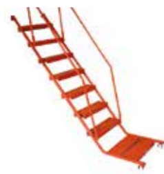
ESCALERA PARA ANDAMIO