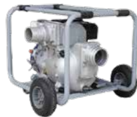
MOTOBOMBA 11HP 4" 3". MOTOR GASOLINA 5.5HP 4". MOTOR GASOLINA 11HP TRAGASÓLIDOS