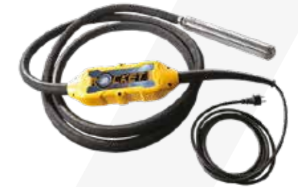
VIBRADOR ELÉCTRICO 110V CHICOTE 5MTS CABEZAL 38MM