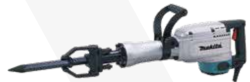
ROMPEDOR ELÉCTRICO 110V DE 16KG