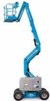
PLATAFORMA ARTICULADA ELÉCTRICA Y/O COMBUSTIÓN ALTURA MIN. DE TRABAJO 12.3M ALTURA MAX. DE TRABAJO 41.5M