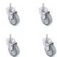
RUEDA DE ANDAMIO