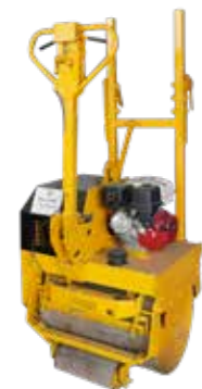
RODILLO SENCILLO MOTOR 9HP PESO OPERATIVO 600KG