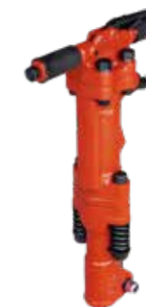
MARTILLO NEUMÁTICO 42 KG Y 30KG INCLUYE MANGUERA 15MTS Y PULSETA