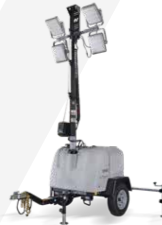
TORRE ILUMINACIÓN · MOTOR DIESEL · EXTENSIÓN MASTIL 8.00M · LÁMPARA LED O HALURO METÁLICO