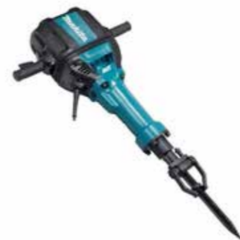
ROMPEDOR ELÉCTRICO 110V DE 30KG