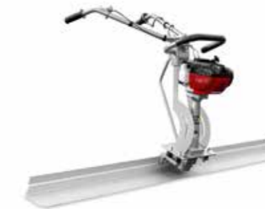
REGLA VIBRATORIA MOTOR DE GASOLINA 3 M, 5M