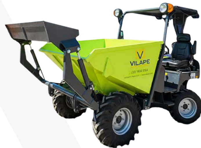
DUMPER 2TN 4X4 MOTOR DIESEL CON Y SIN PALA