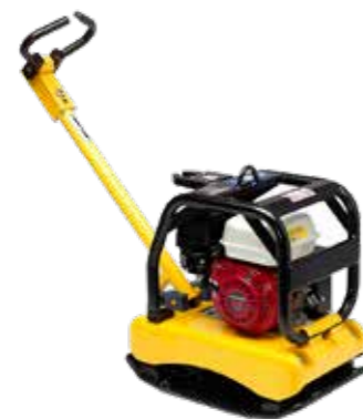
PLACA VIBRATORIA REVERSIBLE MOTOR GASOLINA 5.5HP PESO OPERATIVO 120KG Y 169KG