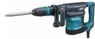
MARTILLO DEMOLEDOR 110V DE 10KG